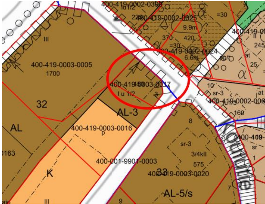
Kartta 2. Kiinteistön sijainti asemakaavassa